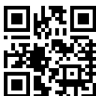
Рисунок 1. Символ QR Code

Пример символа QR Code приведен на рисунке (Рисунок 1).