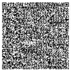
Рисунок 5. Пример изображения двумерного символа штрихового кода с графическим маркером стандарта

Для удобства плательщиков и сотрудников принимающих организаций необходимо обеспечить визуальное отличие двумерных символов штрихового кода, сформированных согласно текущему стандарту, от прочих символов штрихового кода, печатаемых на платежных документах. При использовании нескольких символов штрихового кода на платежном документе, рекомендуется дополнить изображение двумерного символа штрихового кода, сформированного по стандарту, графическим маркером – двумя расходящимися от нижнего правого угла символа линиями, параллельными сторонам символа штрихового кода.