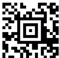
Рисунок 2. Символ Aztec Code

Пример символа Aztec Code приведен на рисунке (Рисунок 2).