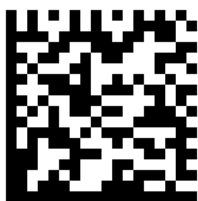
Рисунок 3. Символ Data Matrix

Пример символа Data Matrix приведен на рисунке (Рисунок 3).